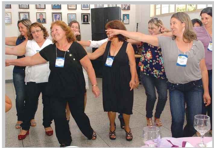
Participantes do encontro durante uma das varias dinâmicas.