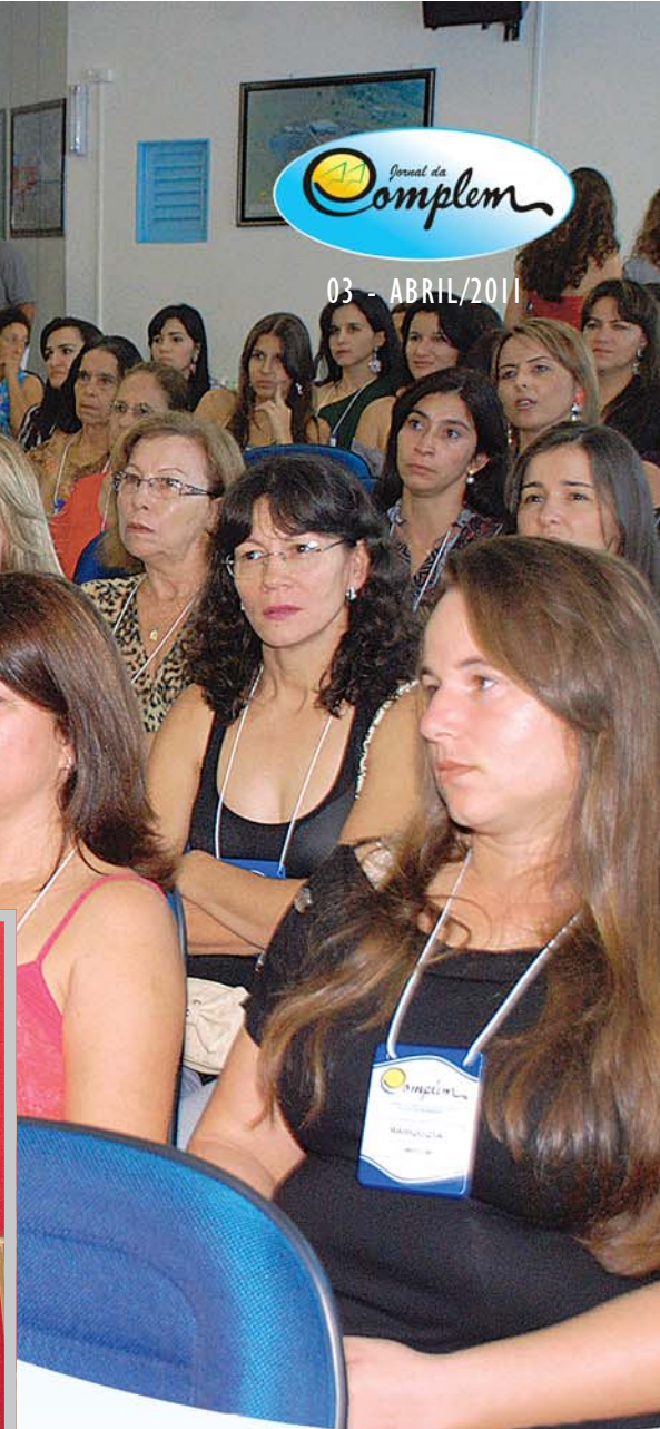
Associadas, esposas e filhas de associados prestigiaram a segunda edição do encontro de mulheres cooperativistas.