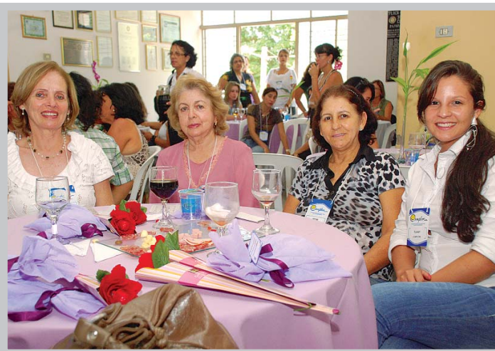
Mulheres que participaram do encontro puderam confraternizar-se com delicioso almoço.

A participação da mulher na vida do nosso País é cada vez maior e mais intensa. Cargos importantes em todas as esferas do poder são ocupados todos os dias pelas representantes do chamado "sexo frágil". Até mesmo a presidência da República elas já conquistaram. Tentando mostrar o seu real valor, reconhecendo a sua participação fundamental na vida das fazendas produtoras e, ao mesmo tempo, aproximar mais as mulheres que vivem o dia-a-dia do cooperativismo foi realizado, no dia 12 de março, o "II Encontro de Mulheres Cooperativistas da Complem".