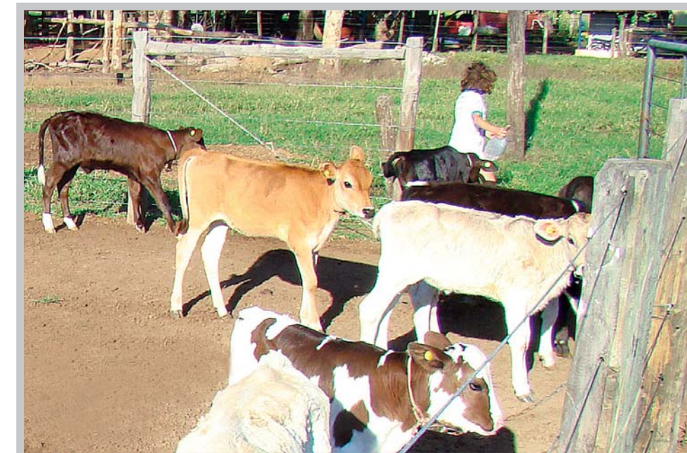
Bezerras sendo alimentadas separadamente, trazendo mais economia e eficiência ao sistema.