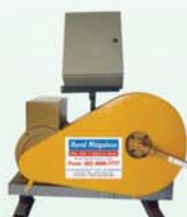
Gerador acionado p/ trator