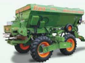
Distribuidor de Calcário

MORRINHOS: (64) 3413-6600 GOIÂNIA: (62) 4009-7777