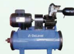
Grupo de vacuo